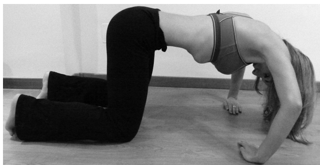
Figura 1 Hipopresivo en cuadrupedia. Colocación: en cuadrupedia; tobillos en flexión y dedos apoyados; brazos en rotación interna, codos ligeramente flexionados y abducción de escápulas; barbilla pegada al pecho. Ejecución: realizar 3 ciclos de inspiración (nariz)-expiración (boca) forzada. Tras la última expiración mantener la apnea y abrir al máximo las costillas. Tras 10-30 s, inspirar. Repetir 3 veces el ejercicio.

los músculos intercostales laterales, elevando las costillas y generando un ensanchamiento de la caja torácica en dirección anteroposterior y transversal. El músculo esternocleidomastoideo y los músculos serratos anteriores y posteriores pueden ayudar a esta acción creando una «inspiración forzada». La «expiración tranquila o normal» es un proceso pasivo que comienza cuando se relajan los músculos inspiratorios disminuyendo la cavidad torácica junto a la retracción elástica del tejido pulmonar. En la «expiración forzada» se contraen los músculos espiratorios (intercostales internos y abdominales: transverso, oblicuo menor y mayor y recto abdominal) que empujan los órganos abdominales contra el diafragma relajado, aumentando su forma de cúpula y disminuyendo por tanto el diámetro de la cavidad torácica 10,11 .